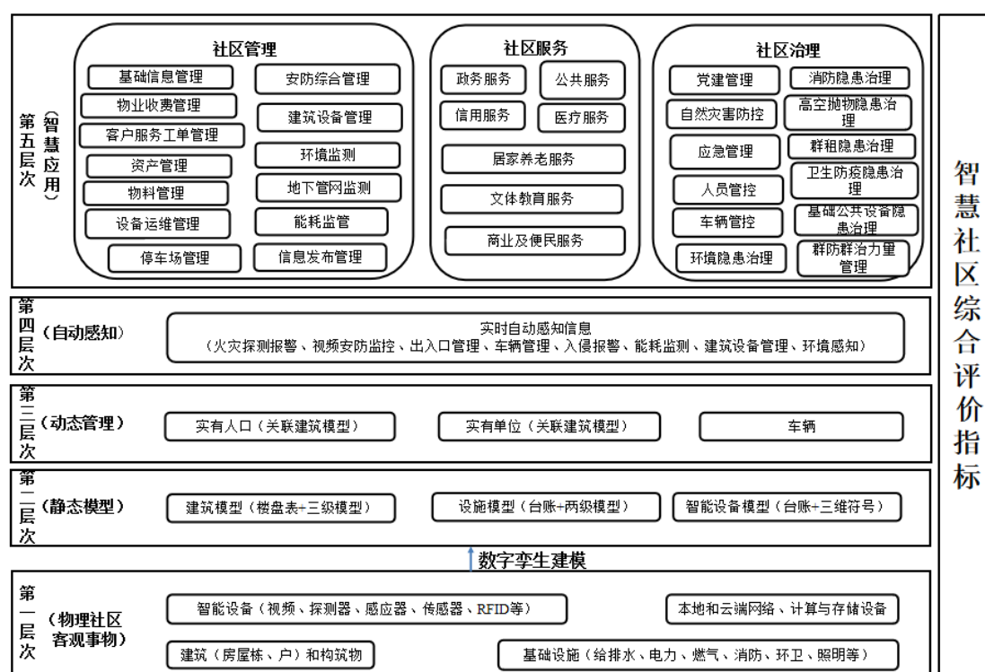
图 3.1.1 基于 CIM 的智慧社区总体框架

3.1.1 基于 CIM 的智慧社区应包含物理社区、静态模型、动态管理、自动感知和智慧应用五个层次，以及综合评价指标，其总体框架宜符合图 3.1.1 的规定。